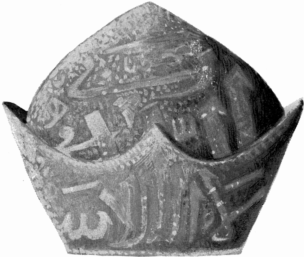
کلاه منسوب به شمس تبریزی «محفوظ در موزه قونیه»